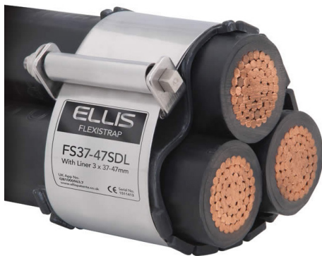
STANDARDLEISTUNG GEEIGNET FÜR DEN EINSATZ MIT VULCAN+ KABELHALTER

Patentnummer Britisches Patent GB 252 6331